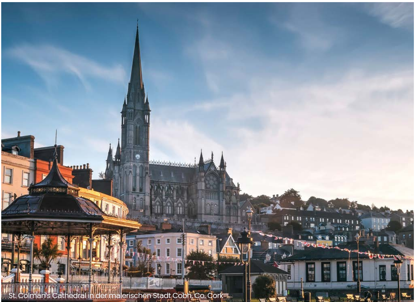
St. Colman's Cathedral in der malerischen Stadt Cobh, Co. Cork

(1) Befreiung für zu Wohnzwecken vermietete Grundstücke weltweit: Die Steuerbefreiung für zu Wohnzwecken vermietete Grundstücke (§ 13d ErbStG) soll künftig unabhängig davon, ob diese im Inland, in einem EU-Mitgliedstaat oder in einem Drittstaat belegen sind, möglich sein. Als Voraussetzung ist vorgesehen, dass in Bezug auf die Erbschaftsteuer ein Informationsaustausch mit diesem (Dritt-)Staat sichergestellt ist.