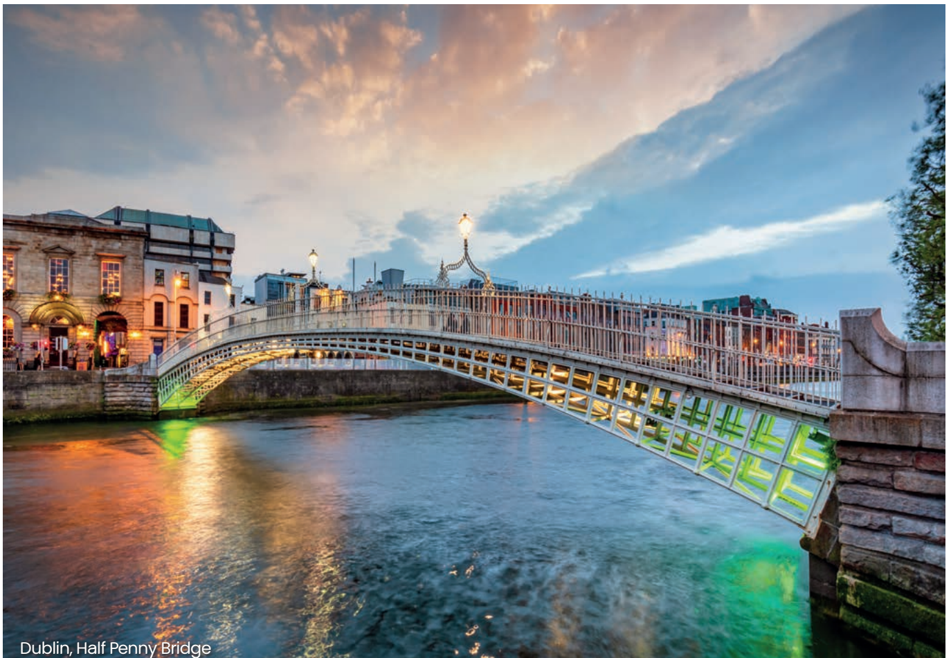
Dublin, Half Penny Bridge

Die Rechnung muss dem Format nach der CEN-Norm EN 16931 entsprechen. Möglich ist, dass sich der Rechnungsaussteller und Rechnungsempfänger auf ein anderes strukturiertes elektronisches Format einigen. Voraussetzung ist dabei aber, dass die notwendigen Informationen so extrahiert werden können, dass das Ergebnis der CEN-Norm EN 16931 entspricht oder mit dieser kompatibel ist.