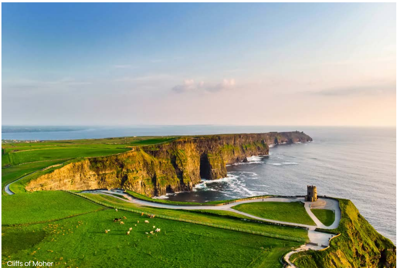
Cliffs of Moher

Überlässt das inländische Unternehmen dem Produktionsunternehmen eine bestehende Geschäftsbeziehung und verzichtet es somit auf zukünftige Gewinne, kann darin eine verdeckte Gewinnausschüttung liegen. Steuerliche Folgen ergeben sich jedoch nur, wenn es sich um eine „konkrete Geschäftschance“ handelt, der ein Wirtschaftsgutcharakter zukommt. Dafür ist u.a. von Bedeutung, dass die Geschäftschance vom Unternehmen tatsächlich wahrgenommen werden kann. Dies ist zweifelhaft, wenn die Fortführung des Geschäfts für das inländische Unternehmen wirt-