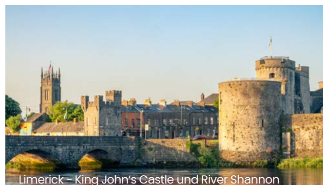
Limerick – King John's Castle und River Shannon

Empfehlung: Gelingt ihnen das, hat der jeweilige Arbeitgeber i.d.R. zu zahlen. Unternehmen sollten demnach stets nach der DSGVO geltend gemachte Ansprüche ernstnehmen.