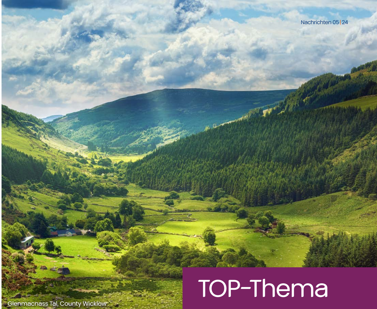
Glenmacnass Tal, County Wicklow

Titelfoto: Samuel-Beckett-Bridge über den Lyffe, Dublin